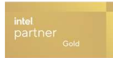
Intel Gold Partner